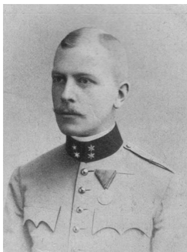
kníže Otto Windischgrätz