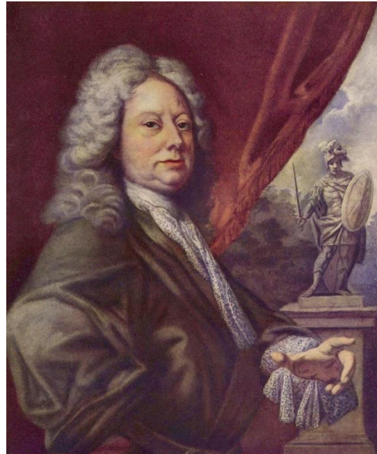
2) hrabě František Antonín Špork