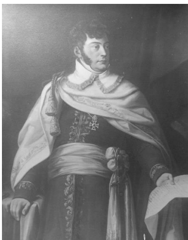
hrabě Kristián Kryštof Clam-Gallas