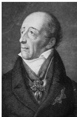
hrabě Johann Filip Stadion