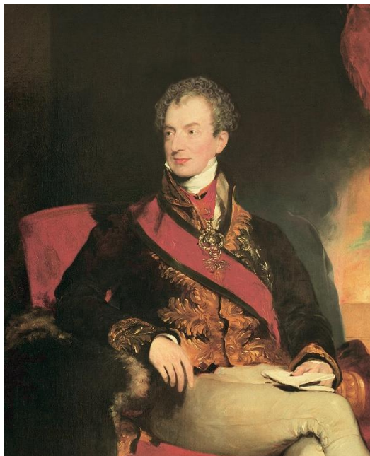
1) kníže Klemens Václav Metternich

A. Prohlédněte si portréty čtyř šlechticů a chronologicky je za sebe seřad'te podle toho, jak jsou vyobrazeni, od nejstaršího portrétu po nejmladší.