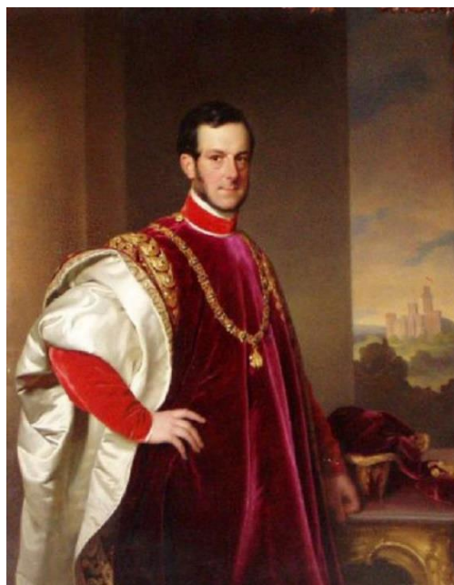
4) kníže Jan Adolf II. ze Schwarzenbergu